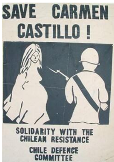
Comité Internacional de Solidaridad con Carmen Castillo